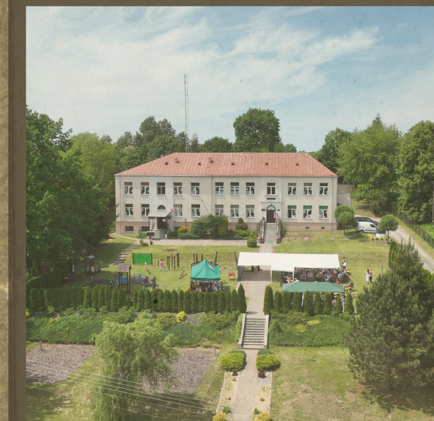
Publiczna Szkoła Podstawowa im. Marszałka Józefa Piłsudskiego w Strzyżewicach-Rehcie

Dzięki temu jubileusz nie stał się jednorazową uroczystością, lecz cyklem wydarzeń, które realnie angażowały uczniów, nauczycieli, rodziców, absolwentów i partnerów lokalnych, umacniając poczucie tożsamości gminy oraz podkreślając rolę szkoły jako ważnego centrum życia społecznego.