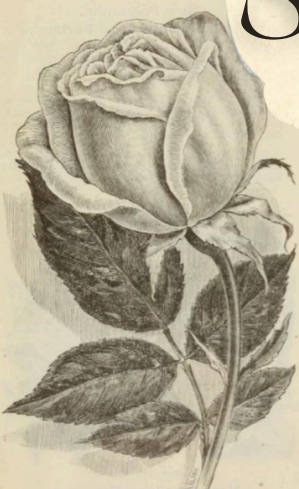
COMTESSE DE FRIGNEUSE.

W ramach obchodów 650-lecia Strzyżewic szkoła w Strzyżewicach-Rehcie przeprowadziła cykl działań, które w spójny sposób łączyły edukację, kulturę, pamięć o lokalnej historii oraz integrację środowiska szkolnego i gminnego.